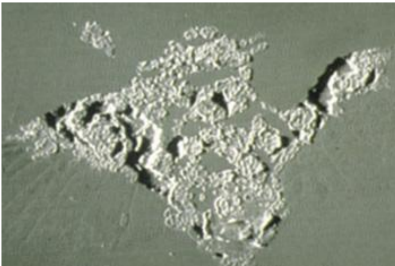
Markierung einer Fliege, 25fache Vergrößerung